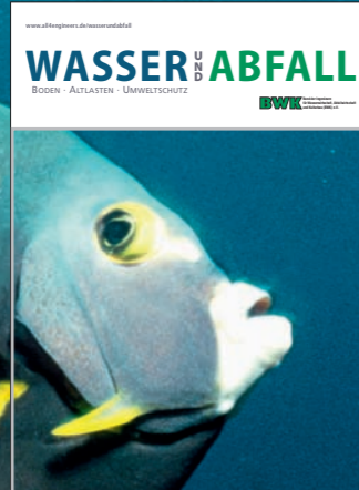
Als Mitglied erhalten Sie die Zeitschrift „WASSER UND ABFALL“ jeden Monat gratis.

Wenn Sie diese Angebote nutzen, werden Sie anderen immer einen Schritt voraus sein.